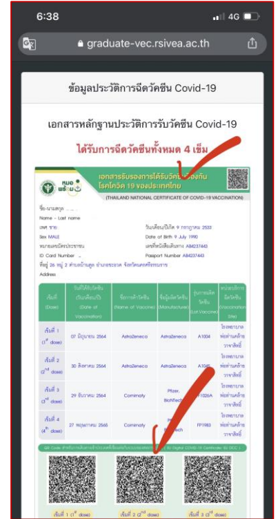
9. หลังจากกดปุ่มบันทึกแล้ว ระบบจะแสดงเอกสารหลักฐานที่ได้อัปโหลดเข้าระบบเรียบร้อยแล้ว ตรวจสอบอีกครั้งว่าถูกต้องหรือไม่