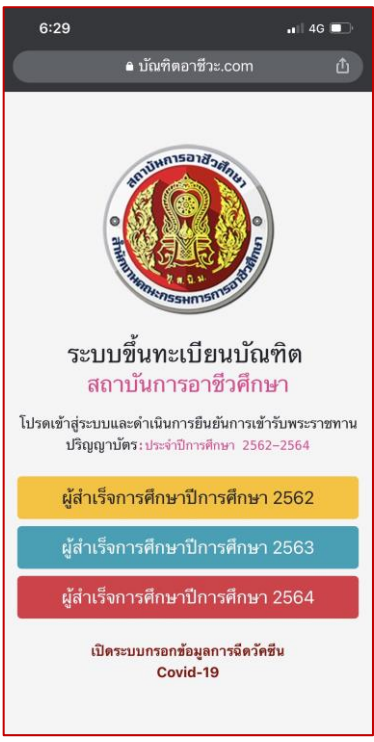
5. เข้าเว็บไซต์ www.บัณฑิตอาสาชีวะะ.com เลือกปีที่สำเร็จการศึกษา