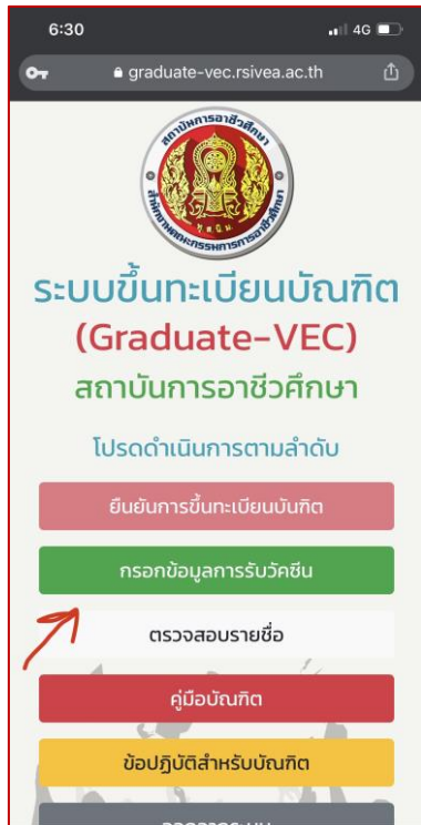
7. กดปุ่ม “กรอกข้อมูลการรับวัคซีน”