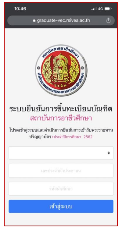
6. เลือกสถาบันการอาชีวศึกษากรอกชื่อผู้ใช้ และรหัสผ่าน