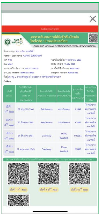
4. แก้ไขประวัติใบรับรองการฉีดวัคซีนและบันทึกไว้ในอัลบั้มรูปในโทรศัพท์มือถือของตนเอง