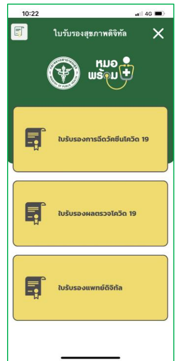
3. กดปุ่ม “ใบรับรองการฉีดวัคซีนโควิด 19”