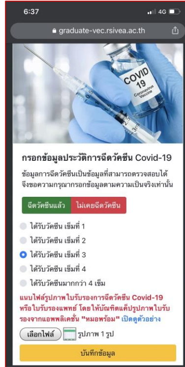
8. กดปุ่ม “ฉีดวัคซีนแล้ว” และกดเลือก “เลือกไฟล์” ด้านล่าง เพื่อเลือกไฟล์รูปภาพใบรับรองการฉีดวัคซีนที่แคปหน้าจอมาจากแอปพลิเคชันหมอพร้อม ที่เก็บไว้ในอัลบั้มรูป ในข้อที่ 4 ที่ผ่านมา หลังจากเสร็จเรียบร้อยแล้วให้ทำการกดปุ่มบันทึกข้อมูล สีเหลือง ด้านล่างเสร็จสิ้นขั้นตอน