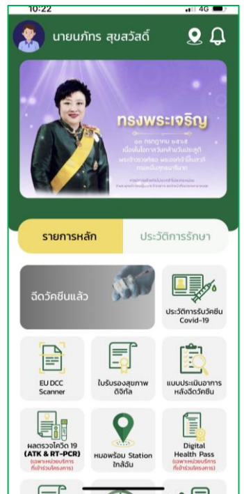
2. กดปุ่ม “ใบรับรองสุขภาพดิจิทัล”